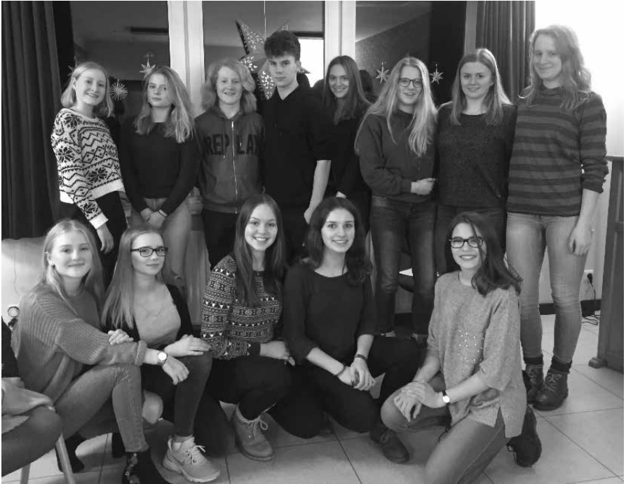
Ev. Jugend, St. Dionys